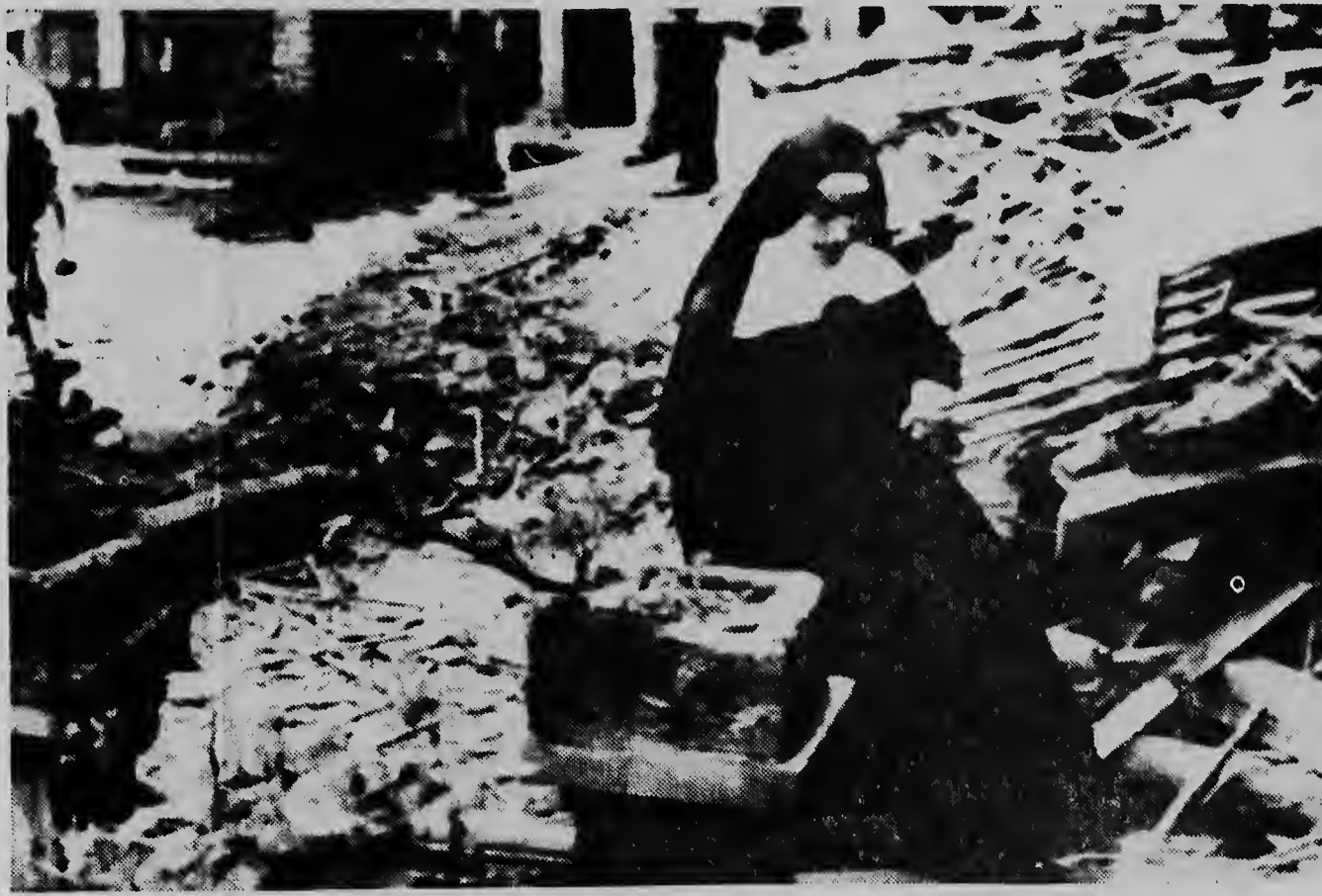
Cien mucha y cuater maestra a muri oracu un capilla di e convento Biblean na Ecuador a basha den otro. Entre e victimanan ta e madre-superior na cual su honor di 25 aniversario nan tabata tene un solemnidad religioso den e capilla di e scool ora cu e edificio a basha abau. Tres cien persona mas tantu mucha, a worde dera. Tambe tin hopi heridanan. Riba e portret aki nos ta mira un soeur, cu ta trata pa hantia algu ainda entre e restonan.

E partido a finaliza cu e scoreboard marcando un gol pa band. Un score cu ta refleja debidamente com e wega tabata.